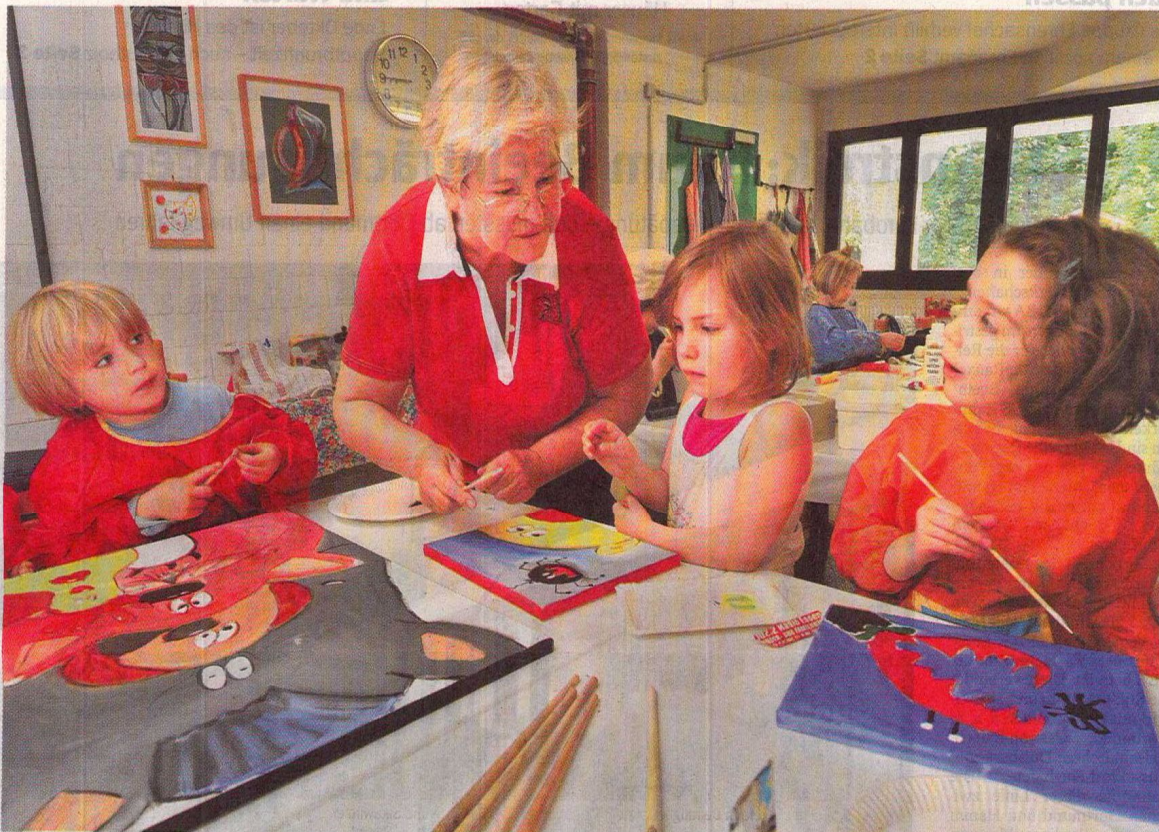
Das Ehrenamt muss passen: Als Kindergarten-Omi sollte sich z. B. nur engagieren, wer Spaß am Umgang mit Kindern hat.

Die Gruppe „Ehrensache!“ hilft Menschen, das richtige Ehrenamt zu finden. Ehrenamtlich natürlich